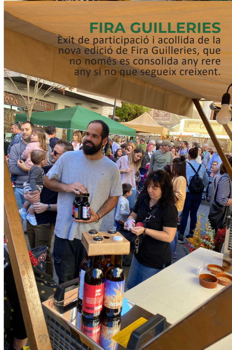
FIRA GUILLERIES Èxit de participació i acollida de la nova edició de Fira Guillerries, que no només es consolida any rere any si no que segueix creixent.