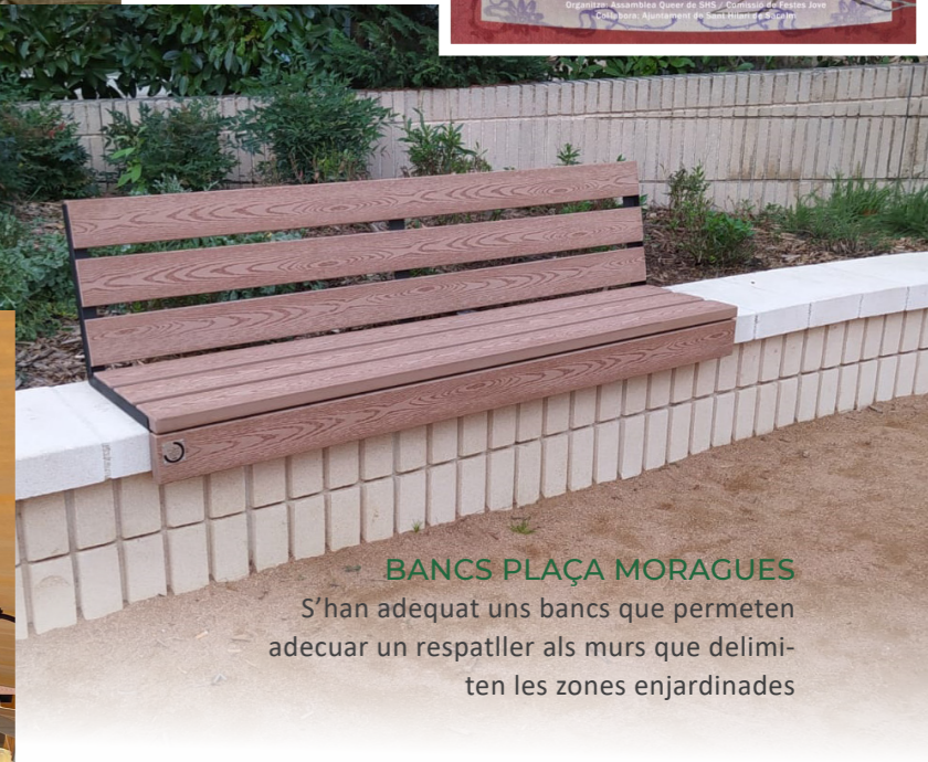
BANCS PLAÇA MORAGUES S'han adequat uns bancs que permeten adequar un respallier als murs que delimiten les zones enjardinades