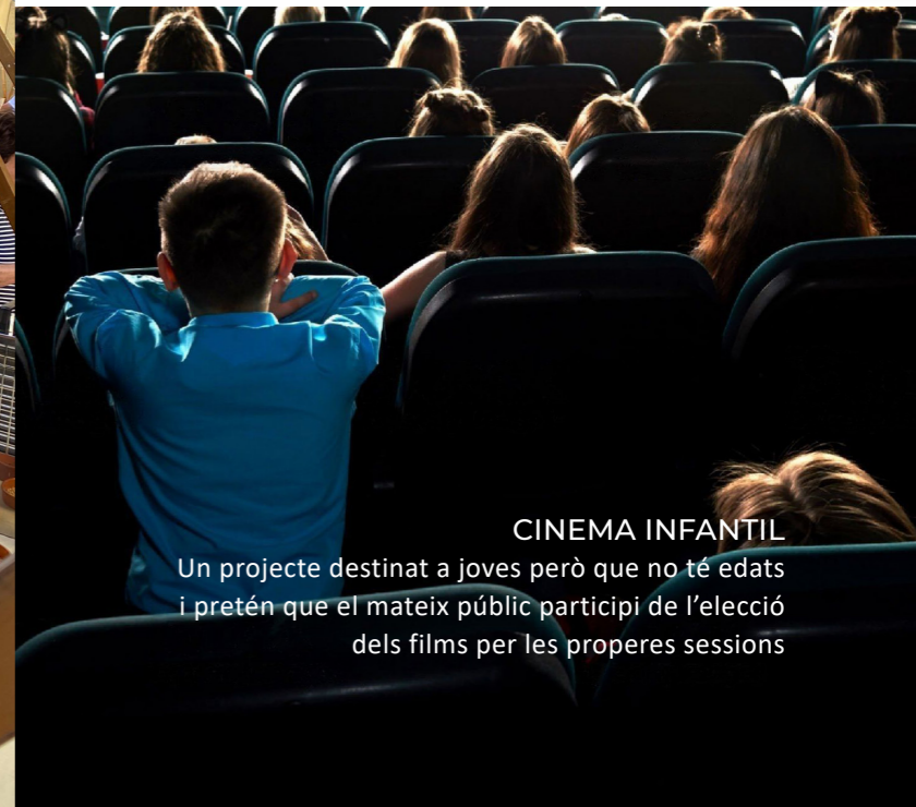
CINEMA INFANTIL Un projecte destinat a joves però que no té edats i pretén que el mateix públic participi de l'elecció dels films per les properes sessions