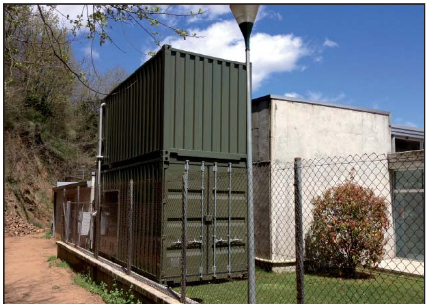
Imatge de la caldera de biomassa del poliesportiu.