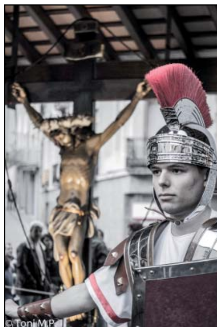
Guanyador concurs Via Crucis: @enganxat