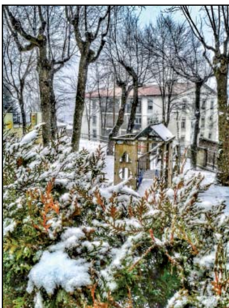
Guanyador foto setmanal, 1era setmana: @manela_gi

Us donem les gràcies a tots per participar en els concursos de l'Instagram del Partit Independent de les Guilleries i us animem a seguir fent-ho.