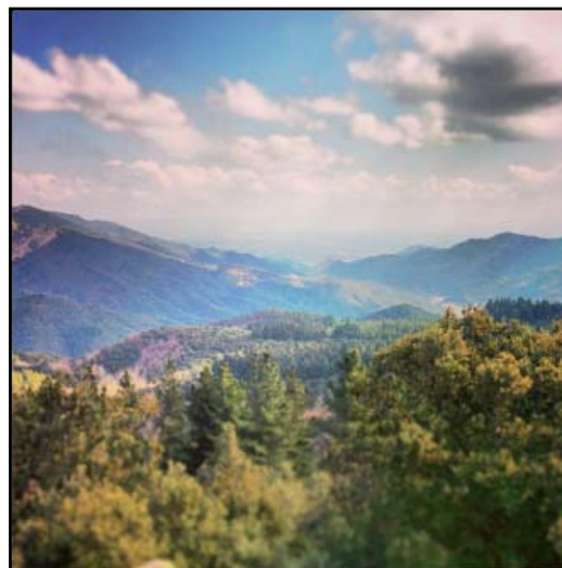
Guanyador concurs entorn: @tonigalvez11