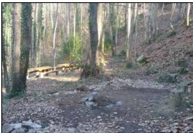
Àrea de pícnic a la Font de Sant Roc.

En aquest punt es va aprovar el conveni amb el Consell Comarcal per posar en marxa un nou pla d'ocupació que permet ocupar dues persones durant sis mesos. Aquest pla es va concedir a l'ajuntament per posar en marxa dos projectes que es van presentar i que, ahora, permetran complir amb dos compromisos del programa