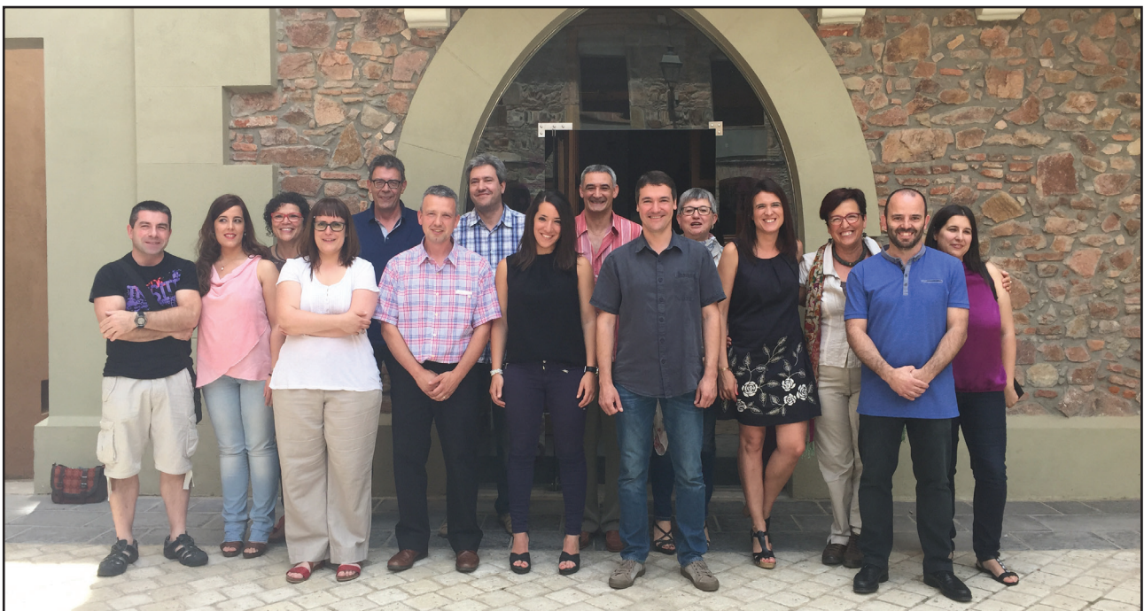
Fotografia del 13 de juny del 2015, just després de prendre possessió dels càrrecs d'alcalde i regidors i regidores.

En les pàgines interiors del Fem-ho hi trobareu aquest repàs al primer any de mandat.