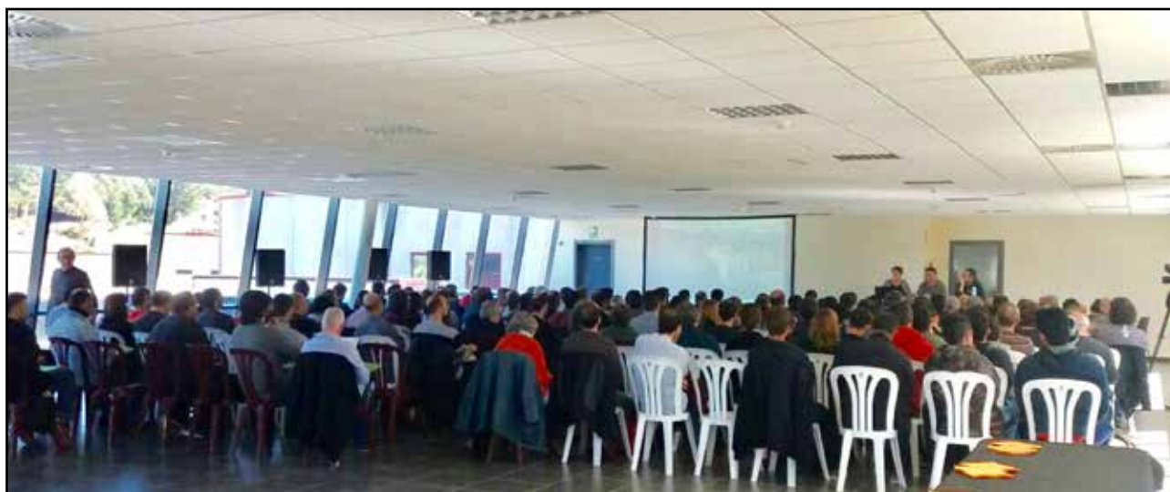
La sala del centre AQUA plena de gent en el decurs de la jornada.

Des del PIG estem satisfets de l'èxit de la jornada, que ha estat la primera de la càtedra AQUA dins el cicle de Jornades Guilleries d'aigua i territori , que s'aniran fent de manera periòdica per abordar diferents problemes relacionats amb el medi ambient, l'aigua i la sostenibilitat mediambiental.